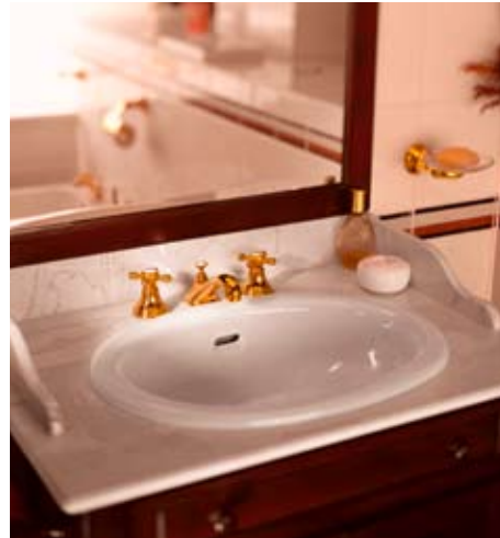
Das edle Design der RETRO Armaturen ist der Blickfang in jedem Badezimmer.

Retro heißt die hochwertige Bad-Kollektion von JADO, und die Nostalgie, die im Namen mitschwingt, prägt auch den Ausdruck der Produkte. Die Armaturen, Brausen und Bad-Accessoires der Linie JADO Retro sind eine Liebeserklärung an die 20er Jahre und den Art déco. Das Design ist elegant und spielerisch. Zierkappen aus Porzellan schmücken die Griffe der Armaturen und unterstreichen das französische Flair dieser klassischen Linie. Auch die Kreuzgriffe erinnern an die Zeit des Jugendstils und Art déco. Fein ausgearbeitete dreistufige Sockel schmücken Armaturen und Accessoires. Sie sind in Anlehnung an klassizistische Säulen gestaltet. JADO Retro zitiert Elemente vergangener Stilepochen, wirkt trotz einer gewissen Extravaganz aber zeitlos elegant.