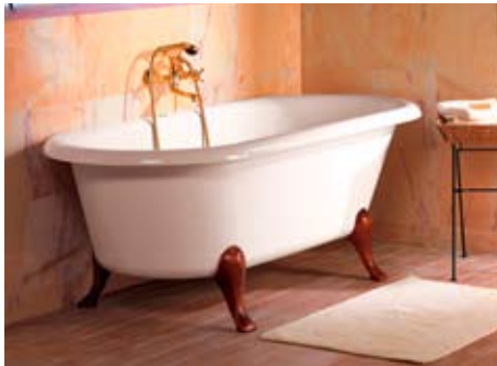
Eine Reminiszenz an den Art déco-Stil: Die Kollektion RETRO von JADO.

Der nostalgische Chick der Armaturen und Brausen wird aufgegriffen in den Bad-Accessoires der Kollektion, die mit edlen Materialien wie Kristall- und Opalglas arbeiten. Zum Programm gehören beispielsweise Handtuchhalter, Spiegel mit integrierter Beleuchtung, Seifenschale und Lotionspender. Viel Spielraum für Individualität bietet JADO Retro auch durch ein ungewöhnlich breites Spektrum an Oberflächen. Der Kunde hat die Wahl zwischen fünf verschiedenen Ausführungen. Die Ar-